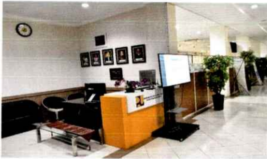
Gambar 3. Ruang Layanan Informasi Publik