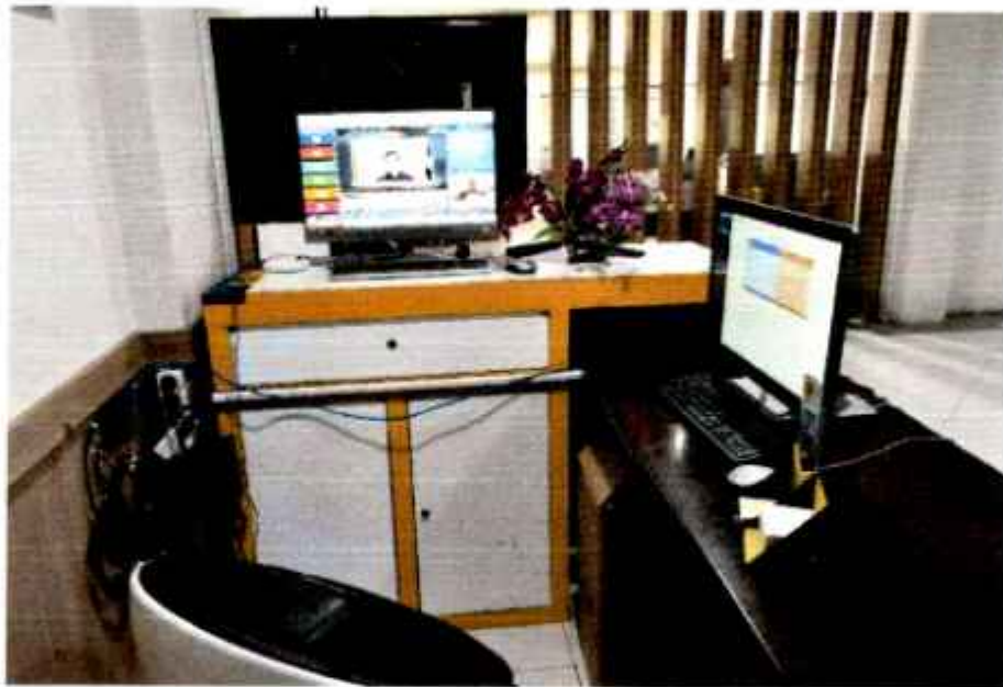
Gambar 4. Ruang Layanan Informasi Publik