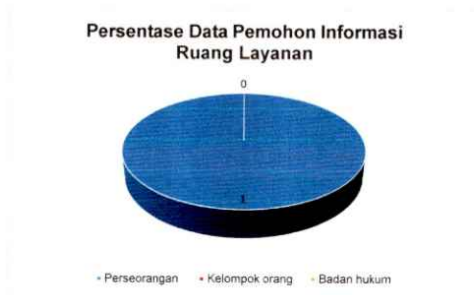
Grafik 2. Persentase Data Pekerjaan Pemohon Informasi melalui Ruang Layanan

Berdasarkan hasil rekapitulasi, diketahuibahwa pemohon informasi melalui ruang layanan informasi berasal dari perseorangan yaitu sebanyak 1 orang pemohon atau sebesar 100% dari keseluruhan pemohon informasi.